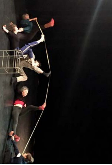
Atelier de pratique « Accessoire ou partenaire : » (déc. 21)

Les actions de médiation artistique et culturelle se sont particulièrement développées ces dernières années. Cela nous a permis d'étendre la présence artistique sur les territoires en relation avec les habitants, en particulier les plus jeunes, de manière à pouvoir proposer de « sortir du théâtre ». En outre, nous souhaitons encore développer des ateliers de pratique artistique, en rapport avec les compagnies programmées, comme un autre moyen d'entrer en contact avec la création, à l'image de l'atelier proposé en décembre par le Ditzz Théâtre.