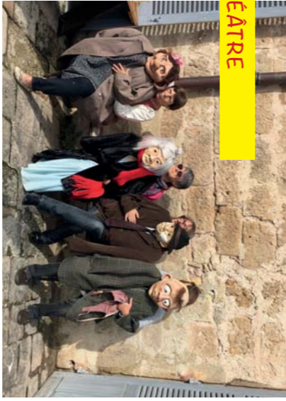
Atelier de pratique « Théâtre physique de marionnettes » avec les Restos du cœur de Largentière (oct. 21)