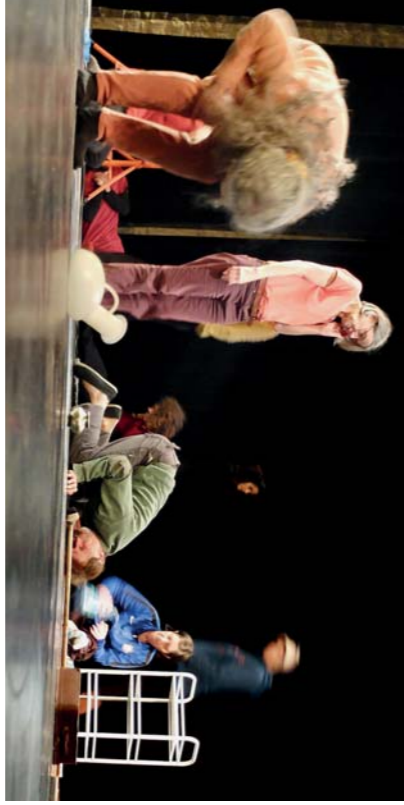
Atelier de pratique « Accessoire ou partenaire : » (déc. 21)