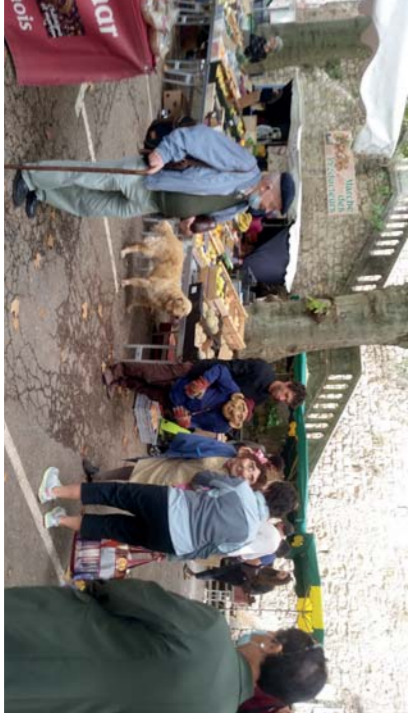
Intervention dans l'espace public « Non Grata » sur le marché de Largentière (sept. 21)